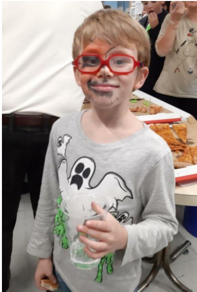
Maquillaxe do benxamin da rondalla.

Mais non desaproveitaron a oportunidade de poder realizar un novo acto de convivencia, para o que, unha vez finalizado o “traballo”, reuníronse co fin de facer un pequeno picoteo a base dunha gran variedade de especialidades de pizza. Foi un momento moi agradábel, en que tamén se gozou dalgunhas maquillaxes e disfraces acordes á festividade👇