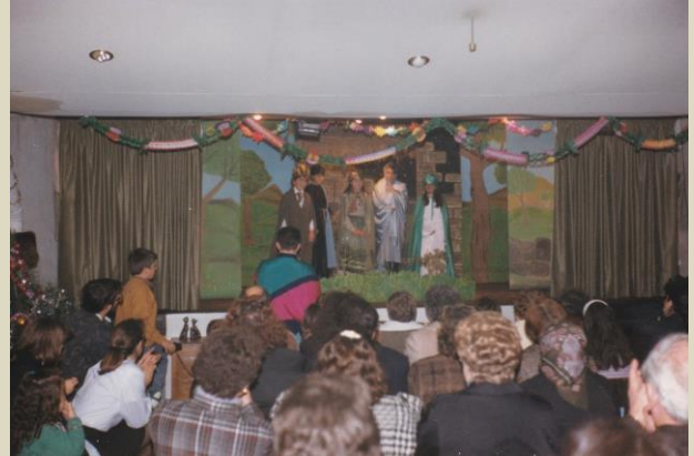
15/12/1990 Festival de Nadal.