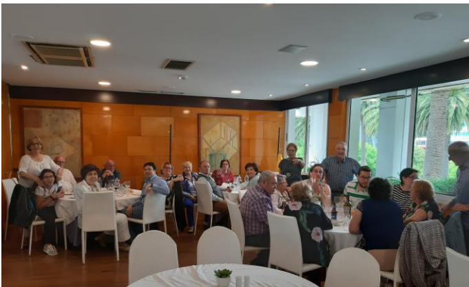
Comer comemos, pero falar non foi menos.

Día 2/6/19. Hora 14. Todas e todos fomos chegando e incorporándonos ao comedor Hotel Eurostars (o antigo NH Atlántico, que igual soa máis) para, ao igual que outros anos, celebrar o xantar dos Grupos Artísticos xunto a familiares, amigos e simpatizantes, todos integrantes da nosa querida e entrañábel Asociación Tanxedoira.