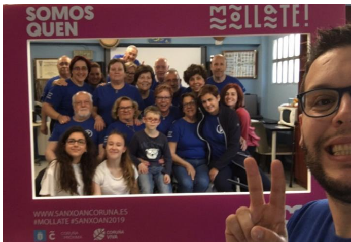
É digno de ser enmarcado.

Tanxedoira ven a colaborar co programa de educación ambiental #Móllate #SanXoán2019 que traballa arreo para salvar os nosos océanos.