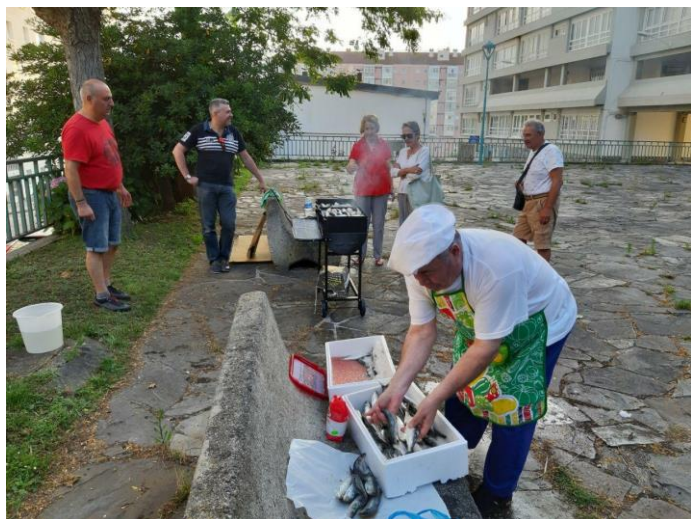
As grellas non daban feito.