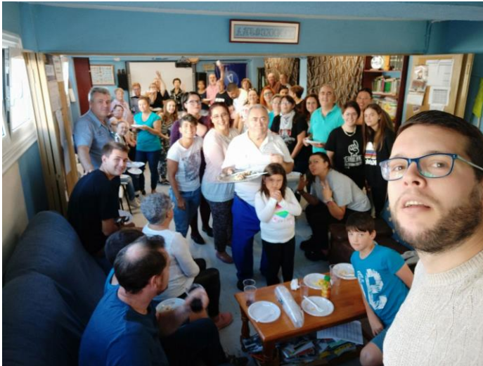
Parte dos comensais. Outros estaban fóra.

Celebrar o magosto, pois, non é unha excusa: é unha razón de peso.