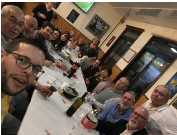
Ás actrices e aos actores tamén lles gustan as enchentes.

Animámosvos a participar desta proposta pola ecoloxía👇