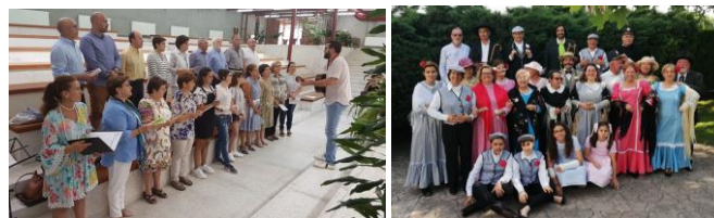
Algunhas das actuacións.

Ambas as dúas circunstancias fixeron posíbel o dar respostas a diferentes solicitudes que demandaban a participación dalgúns dos diversos grupos que ten a asociación. Así, o 24 de maio o grupo de Cantos Populares actuou en Cáritas da Sagrada Familia, sentíndose ben acollido (como é costume) nas súas visitas ás súas instalacións. Tamén o día 31 do mesmo mes, o grupo de Cantos Populares desprazouse até o Centro Cívico da Cidade Vella, alegrando a tarde ás persoas alí presentes, as cales agradeceron a actuación. Continuando coas súas colaboración, o día 8 de xuño, Tanxedoira desprazou até o centro de maiores DomusVI de Oleiros ao seu grupo de Cantos Populares, centro que, o día 9 de xuño, tamén puido gozar da presenza do Grupo de Teatro, que representou a obra Agua, azucarillos y aguardiente . En ambas as dúas actuacións os asistentes mostraron o seu agradecemento con afectuosos aplausos. Finalmente, o coro participou na celebración das comuñóns que se realizaron os días 23 de xuño e 7 e 25 de xullo na parroquia Resurrección do Señor 🙏