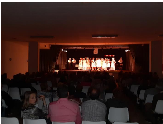
O público asistente encheo a sala.

Desde o patio de butacas desfrutamos ao máximo: risas e algunha que outra bágoa. E é que as zarzuelas, para min son o recordo da infancia. Alén disto, o poder ver os meus pais xuntos, sobre o escenario, compartindo miradas, complicidade e