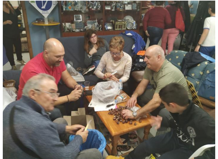
Tamén houbo colaboración antes de asar as castañas.